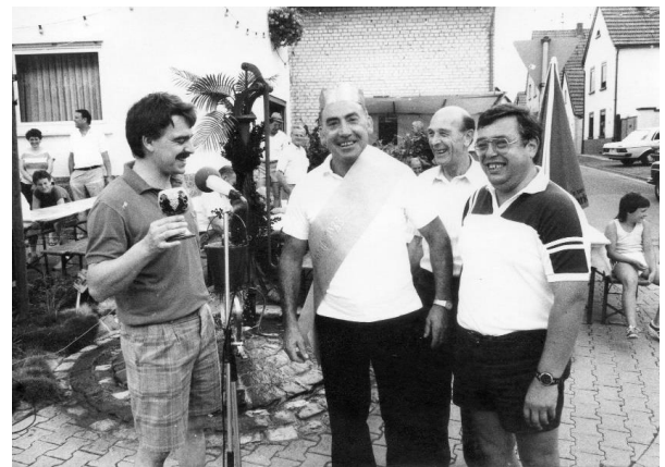
Pumpenfest mit Pumpenkönig 1988

Neben der Darstellung dieser gelebten heimatverbundenen Aktivitäten wird auch ein Buch ausliegen, in dem jeder Besucher eintragen darf, was er mit dem Begriff "Heimat" verbindet. Eine erste Reaktion liegt bereits vor: "Für mich ist Heimat der Geruch von 'Scheier un Kaarschmeer'".