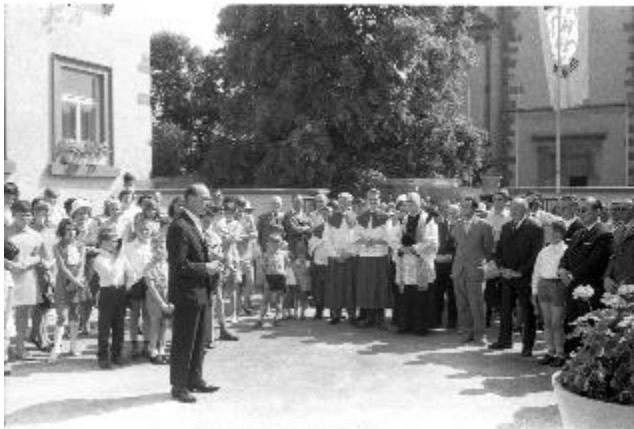
Einweihung Museum Abenheim

Die 65jährige Vereinsgeschichte wird anhand einer großen Fotowand dargestellt. Die vielfältigen Aktivitäten des Vereines wie z.B. frühere archäologische Ausgrabungen in Zusammenarbeit mit dem Museum Worms, Ortsbildpflege, Museum, Skulpturenweg werden aufgezeigt. Aber auch Bilder von geselligen Aktivitäten wie Heimatabende, Vatertagsausflüge, Fastnachtsveranstaltungen etc. werden bei so manchem Abenheimer Bürger Erinnerungen wecken.